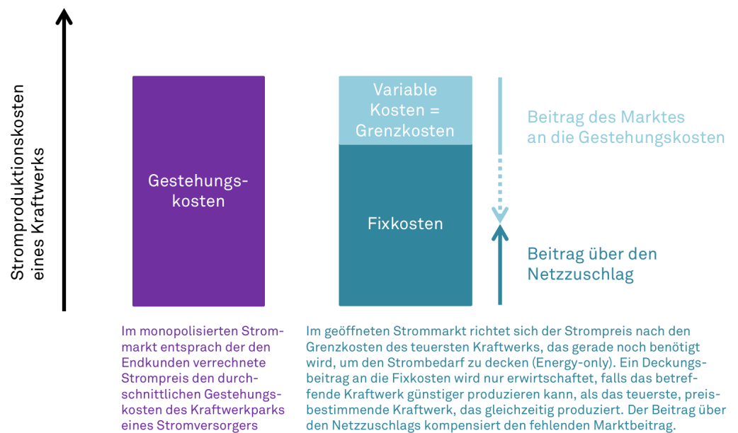
Abbildung 2: Netzzuschlag behebt das Missing-Money-Problem

Weil die Zwecke dieses Gesetzes nur mit einem deutlichen Ausbau neuer erneuerbarer Produktionsanlagen (vergleiche Kapitel 1.1), verstärkten Anstrengungen im Suffizienz- und Effizienzbereich, sowie bei der Ökologisierung des bestehenden Wasserkraftparks erreicht werden können, sind sowohl die heutige maximale Höhe des Netzzuschlags als auch die zeitliche Befristung wenig sinnvoll und führen zu unnötigen Planungs- und Investitionsunsicherheiten. Die Höhe des Netzzuschlags soll sich nach der Zielerreichung (anhand der Ausbau- und Verbrauchsziele, Gewährleistung der Versorgungssicherheit) und den Marktgegebenheiten (Strompreise, höhere Investitionskosten in der Schweiz als im benachbarten Ausland) ausrichten. Das gilt umso mehr, als die geplante vollständige Marktöffnung die Ausgestaltung bisheriger, für gewisse erneuerbare Energien wie Photovoltaik zentrale Finanzierungsinstrumente wie den Rücklieferatarif infrage stellt (vergleiche dazu Kapitel 1.3).